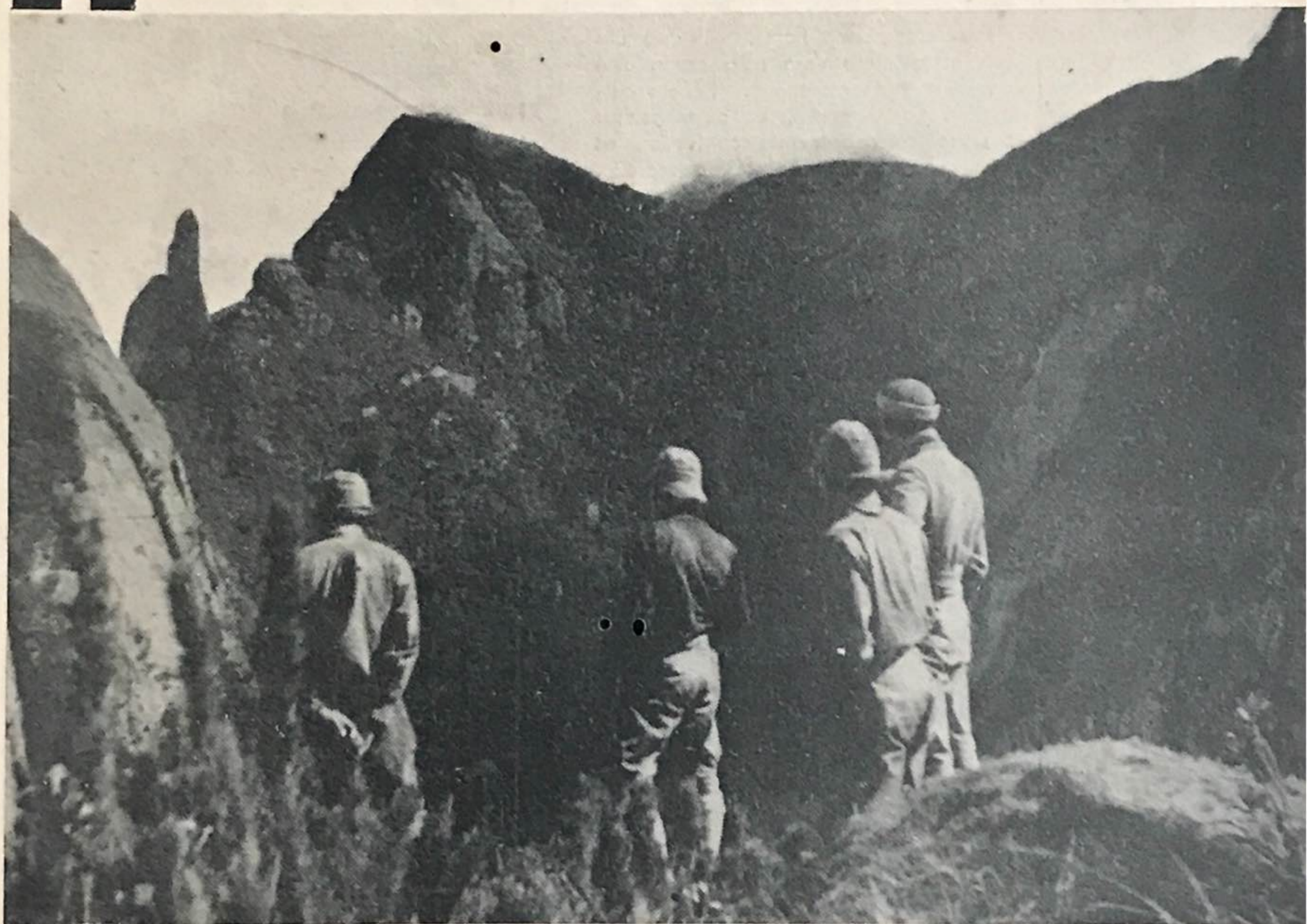
No alto do NARIZ DO FRADE (1.920 mts.)