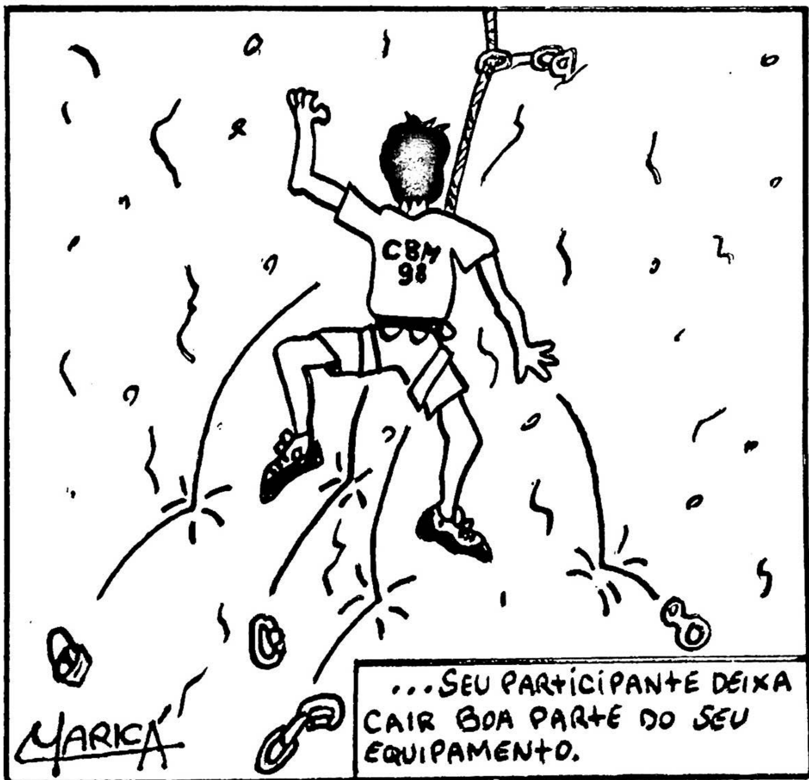
...SEU PARTICIPANTE DEIXA CAIR BOA PARTE DO SEU EQUIPAMENTO.