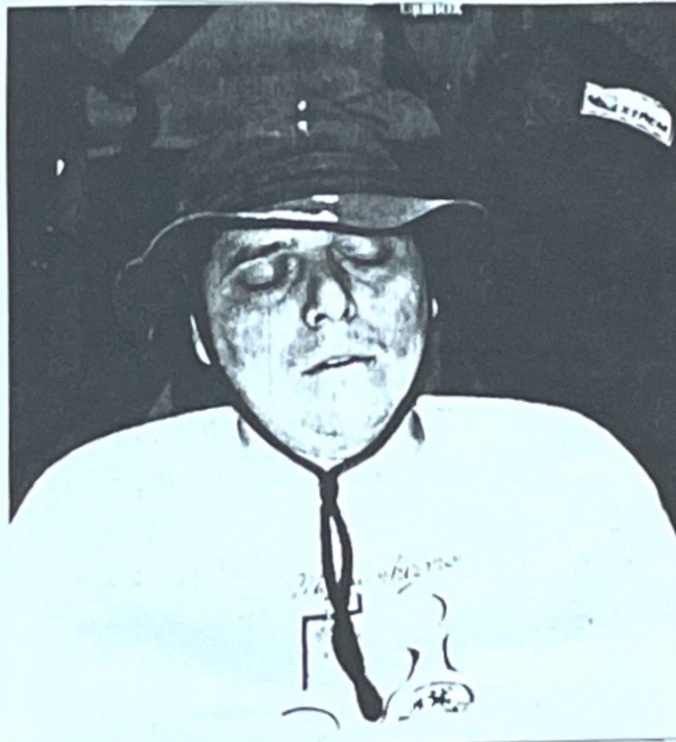
Foto do autor, curtindo a Natureza no cume do Inficcionado.

MEIO-AMBIENTE : POR QUE SÓ MEIO ? PROTEJA-O TODO !