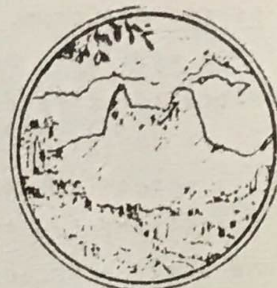
O FRADE E A FREIRA